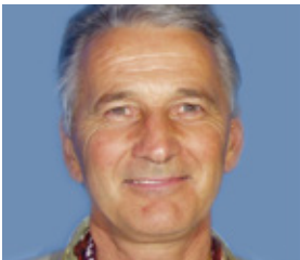
1. 三维相机快速拍照